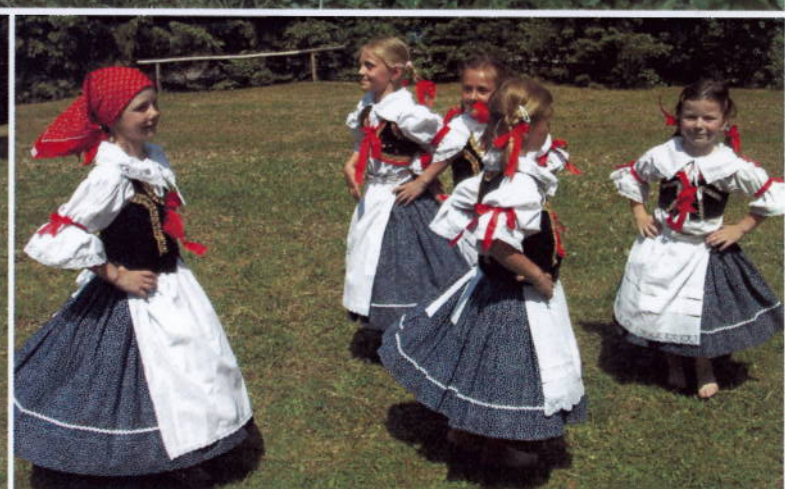
Děvčata z folklorního souboru Bystrouška u rybníčku nedaleko pomníku nalezené Lidušky.