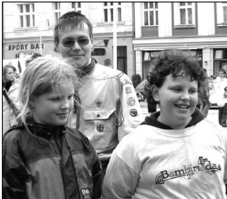
Na Bambiriádách se prezentují všechny organizace, spolky a sdružení pracující s dětmi a mládeží.

A nakonec v sobotu 24. května se celá prezentace vrací do Tábora, ale tentokrát na Tržní náměstí a na dětské dopravní hřiště u Jordánu. Začí-