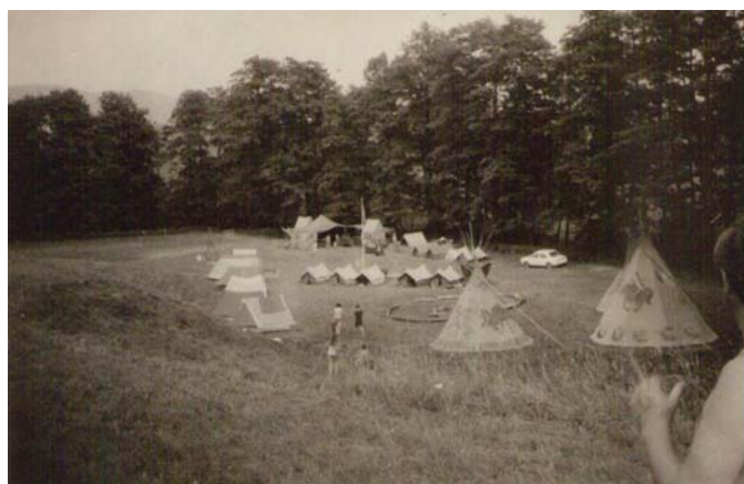
Tábor Ostružno 1981