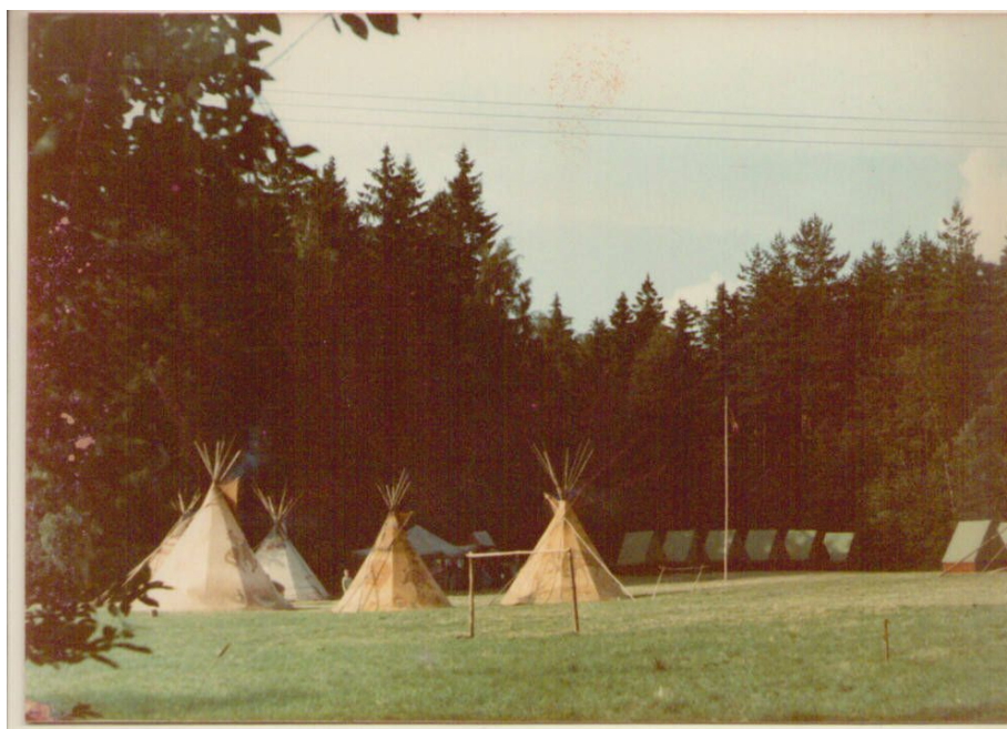
Tábor v Zemi Fajáků v roce 1984

Následující fotografie jsou z Kamzičích táborů