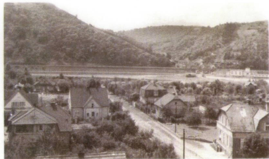
Rež u Prahy.

Rež: první zmínka r. 1086, pohlednice z r. 1938