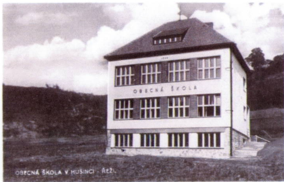
OBECNÁ ŠKOLA V HUSINCI - REŽ.