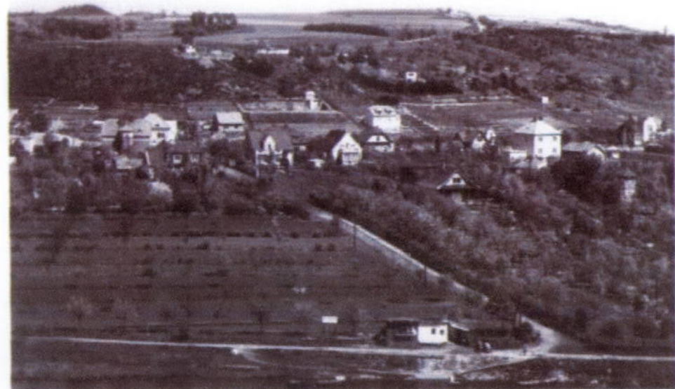
Rež u Prahy.